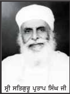
ਸ੍ਰੀ ਸਤਿਗੁਰੂ ਪ੍ਰਤਾਪ ਸਿੰਘ ਜੀ

ਨੌਜਵਾਨ ਤਬਕੇ ਵਿੱਚ ਕੀਰਤਨ ਦਾ ਪਰਵਾਹ ਜ਼ੋਰਾਂ 'ਤੇ ਵਧਣ ਲੱਗਾ ਤੇ ਜਥੇ ਵਿੱਚ ਪੁਰਾਣੇ ਸਰੀਰਾਂ ਦੇ ਨਾਲ ਨਵੇਂ ਸਰੀਰ ਵੀ ਆ ਰਲੇ ਤੇ ਆਨੰਦ ਦਾ ਪਰਵਾਹ ਚੱਲ ਪਿਆ। ਸੰਨ 1948 ਦੀ ਬਸੰਤ ਦਾ ਮੇਲਾ ਵੀ ਇੱਕ ਭਾਗਾਂ ਭਰਿਆ ਦਿਨ ਰਹੇਗਾ। ਇਸ ਦਿਨ ਵੀ ਕਈ ਸਰੀਰ ਦੇਸ਼ ਤੋਂ ਪਹੁੰਚੇ ਸਨ। ਸਵੇਰੇ ਅਖੰਡ ਪਾਠ