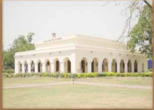
(ਅੱਜ ਦੇ ਸਮੇਂ ਦੀ ਤਸਵੀਰ)

ਬੱਸੀਆਂ ਵਾਲੀ ਕੋਠੀ ਵਿੱਚ ਰਾਇਕੋਟ ਸਾਕੇ ਦੇ ਤਿੰਨਾਂ ਸਿੰਘਾਂ