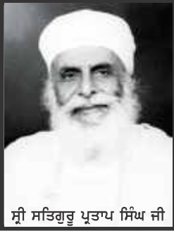
ਸ੍ਰੀ ਸਤਿਗੁਰੂ ਪ੍ਰਤਾਪ ਸਿੰਘ ਜੀ

ਡਾਕਟਰ ਦੇ ਕਹਿਣ 'ਤੇ ਕਿ ਇਨ੍ਹਾਂ ਦਾ ਅੰਤ ਦਾ ਸਮਾਂ ਨੇੜੇ ਆ ਗਿਆ ਹੈ, ਫਿਰ ਵੀ ਆਪ ਹੋਸ਼ ਵਿੱਚ ਆ ਗਏ ਤੇ ਬੁਖਾਰ ਵੀ ਘਟ ਗਿਆ ਤੇ ਉਹ ਪਰਿਵਾਰ ਦੇ ਜੀਆਂ ਨਾਲ ਬਚਨ-ਬਿਲਾਸ ਵੀ ਕਰਦੇ ਰਹੇ, ਪਰ ਇਹ ਆਪ ਜੀ ਦੇ ਆਖਰੀ ਦਿਨ ਸਨ ਤੇ ਆਪ 12-4-50 ਨੂੰ ਬੁੱਧਵਾਰ ਵਾਲੇ ਦਿਨ ਆਪਣੀ