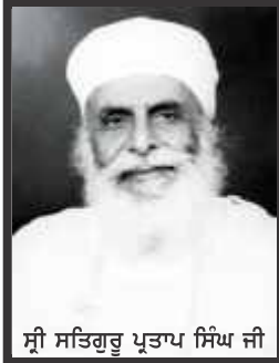
ਸ੍ਰੀ ਸਤਿਗੁਰੂ ਪ੍ਰਤਾਪ ਸਿੰਘ ਜੀ