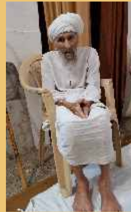
ਜਪ ਪ੍ਰਯੋਗ ਵਿੱਚ 7-8 ਸਾਲ ਦੇ ਬੱਚੇ ਅਤੇ 107 ਸਾਲ ਦੇ ਬਜ਼ੁਰਗ।