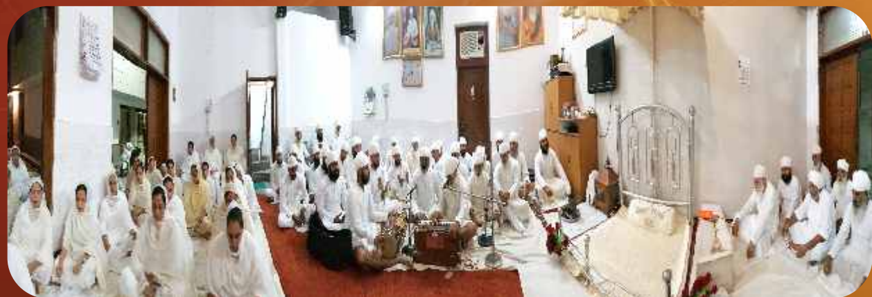
ਨਾਮ ਸਿਮਰਨ ਜਪ ਪ੍ਰਯੋਗ ਵਿਸ਼ਨੂੰ ਗਾਰਡਨ, ਦਿੱਲੀ।