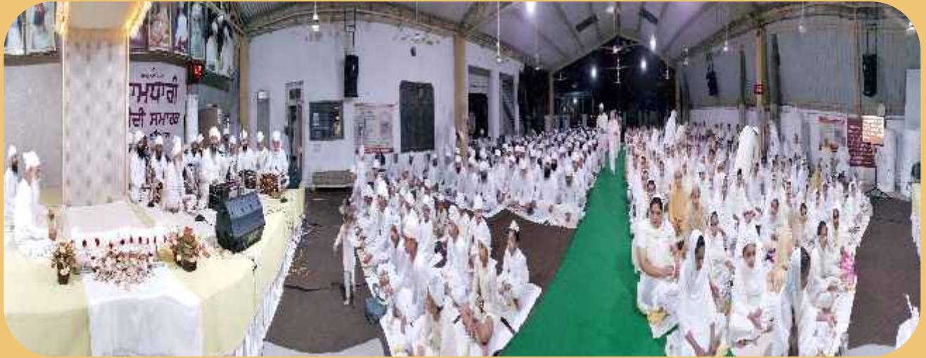
ਨਾਮ ਸਿਮਰਨ ਜਪ ਪ੍ਰਯੋਗ ਸ਼ਹੀਦੀ ਸਮਾਰਕ ਲੁਧਿਆਣਾ।