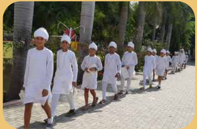
ਸ੍ਰੀ ਭੈਣੀ ਸਾਹਿਬ ਦੇ ਨੌਜੁਆਨ ਅੱਸੂ ਦੇ ਮੇਲੇ ਦੀ ਆਰੰਭਤਾ ਸ੍ਰੀ ਭੈਣੀ ਸਾਹਿਬ ਛੋਟੇ ਬੱਚੇ ਜਪ ਪ੍ਰਯੋਗ ਲਈ ਜਾਂਦੇ ਹੋਏ। ਤੋਂ ਪਹਿਲਾਂ ਸਾਫ਼-ਸਫ਼ਾਈ ਦੀ ਸੇਵਾ ਕਰਦੇ ਹੋਏ।