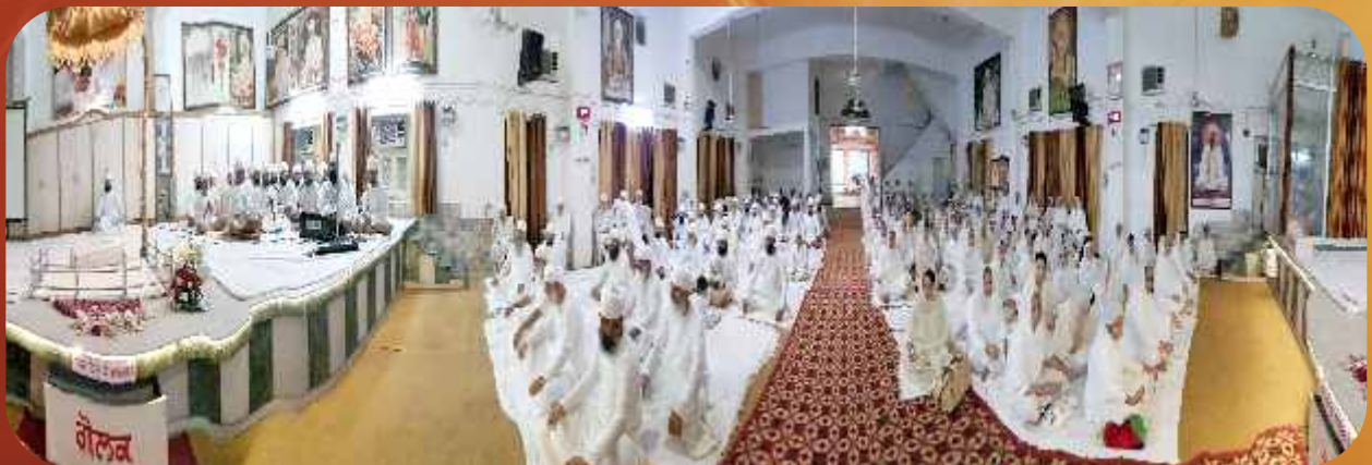
ਨਾਮ ਸਿਮਰਨ ਜਪ ਪ੍ਰਯੋਗ ਸਾਹਿਬਪੁਰਾ, ਦਿੱਲੀ।