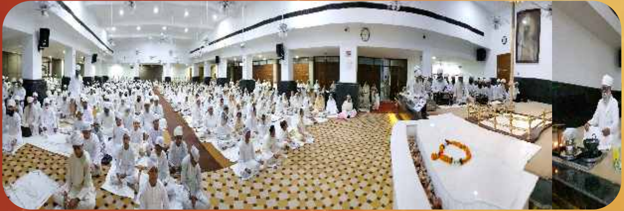
ਨਾਮ ਸਿਮਰਨ ਜਪ ਪ੍ਰਯੋਗ ਰਮੇਸ਼ ਨਗਰ ਦਿੱਲੀ।

RNI NO. 55658/93 Delhi Postal Regd. No. DL(W) 01/2055/18-20