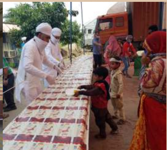
ਨਾਮਧਾਰੀ ਸੰਗਤ ਲੁਧਿਆਣਾ ਵੱਲੋਂ ਸ਼ਹੀਦੀ ਸਮਾਰਕ ਵਿਖੇ ਲੋੜਵੰਦਾਂ ਦੀ ਸੇਵਾ ਸਹਾਇਤਾ