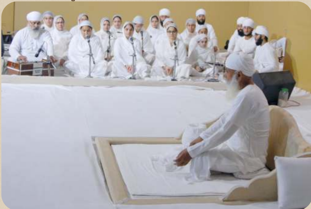
ਸ੍ਰੀ ਸਤਿਗੁਰੂ ਜੀ ਦੀ ਹਜ਼ੂਰੀ ਵਿੱਚ ਫਗਵਾੜੇ ਦੇ ਬੀਬੀਆਂ ਦੇ ਜਥੇ ਵੱਲੋਂ ਆਸਾ ਦੀ ਵਾਰ (ਵਾਰੇ) ਦਾ ਕੀਰਤਨ