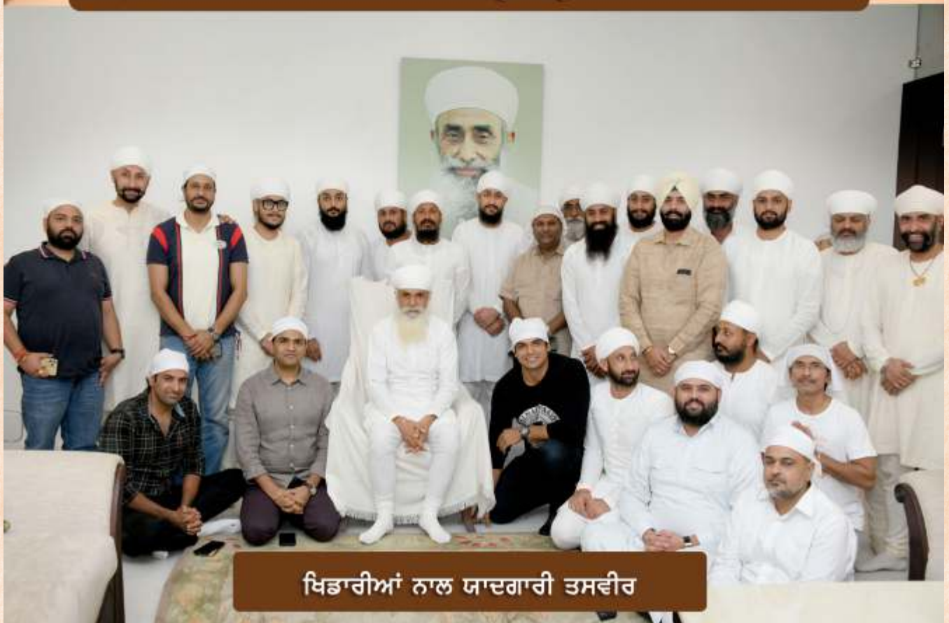
ਖਿਡਾਰੀਆਂ ਨਾਲ ਯਾਦਗਾਰੀ ਤਸਵੀਰ