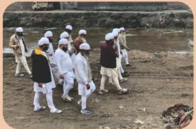
ਸ੍ਰੀ ਸਤਿਗੁਰੂ ਜੀ ਬੁੱਢੇ ਨਾਲੇ ਦੀ ਚੱਲ ਰਹੀ ਮੁਹਿੰਮ ਦਾ ਜਾਇਜਾ ਕਰਦੇ ਹੋਏ।