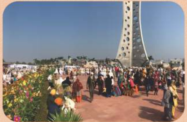
ਮਲੇਰਕੋਟਲਾ ਸ਼ਹੀਦੀ ਮੇਲੇ ਸਮੇਂ ਸਾਧ-ਸੰਗਤ ਖੰਡੇ ਦੇ ਦਰਸ਼ਨ ਕਰਦੀ ਹੋਈ।