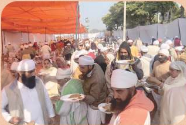
ਮਲੇਰਕੋਟਲਾ ਸ਼ਹੀਦੀ ਮੇਲੇ ਸਮੇਂ ਨੌਜੁਆਨ ਲੰਗਰ ਦੀ ਸੇਵਾ ਕਰਦੇ ਹੋਏ।