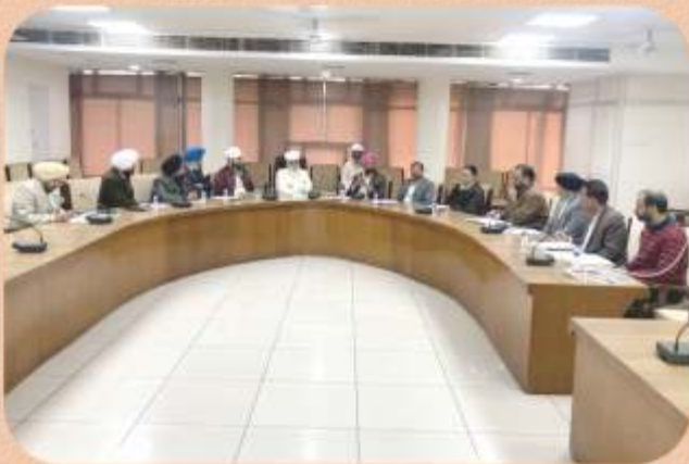
ਸ੍ਰੀ ਸਤਿਗੁਰੂ ਜੀ ਬੁੱਢੇ ਨਾਲੇ ਦੀ ਚੱਲ ਰਹੀ ਸਫਾਈ ਸੰਬੰਧੀ ਮੀਟਿੰਗ ਦੌਰਾਨ ਚੰਡੀਗੜ ਵਿਖੇ।