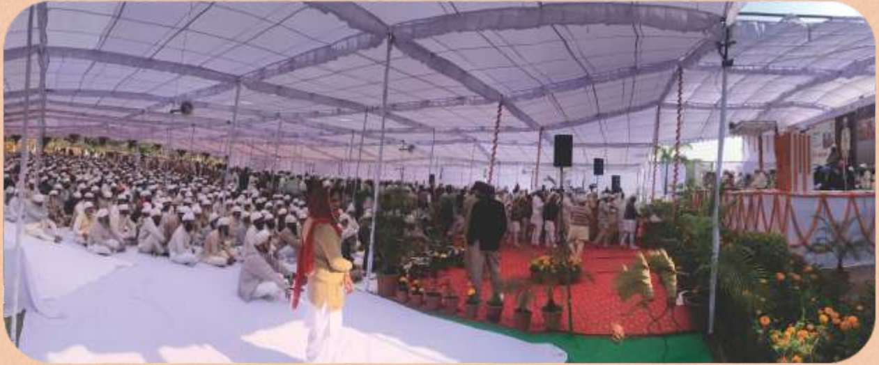
ਸ੍ਰੀ ਸਤਿਗੁਰੂ ਜੀ ਮੇਲੇ ਦੌਰਾਨ ਦਰਸ਼ਨ ਦਿੰਦੇ ਹੋਏ।