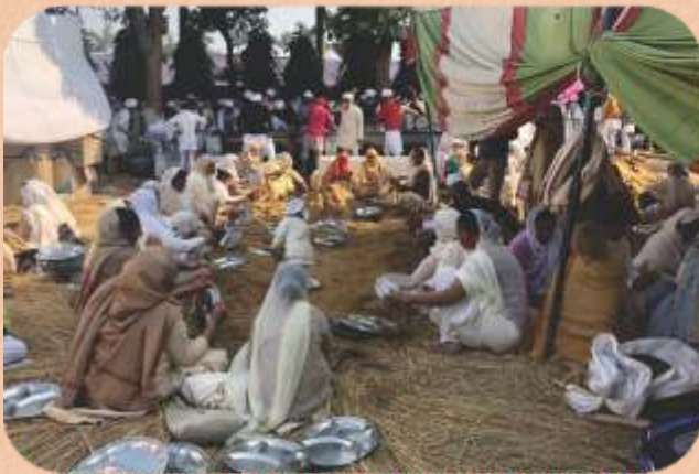
ਮੇਲੇ ਦੌਰਾਨ ਬੀਬੀਆਂ ਭਾਂਡਿਆਂ ਦੀ ਸੇਵਾ ਕਰਦੇ ਹੋਏ।