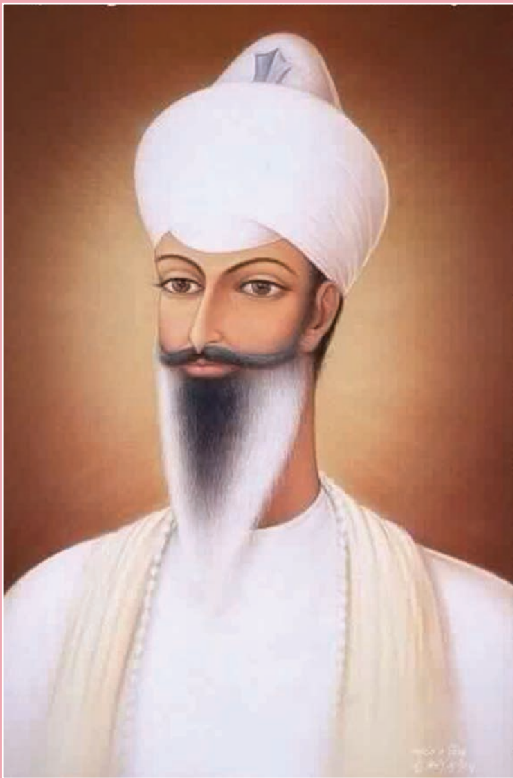
ਸ੍ਰੀ ਸਤਿਗੁਰੂ ਰਾਮ ਸਿੰਘ ਜੀ